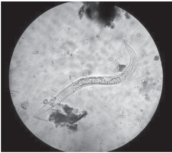
Fig. 7. Nemátodo fotografiado a 400x, en heces fecales de C. mumia chrysalis .

Una gran actividad bacteriana se hizo presente en todas las muestras, la que podría ser una fuente de ayuda complementaria en la síntesis de nutrientes. La presencia de nemátodos (Fig. 7) resultó en 0,75% (N= 15 C). Otras representaciones de fauna endógena observadas fueron protozoos ciliados. La presencia de nemátodos en las heces de moluscos terrestres ha sido reportada por Díaz-Piferrer (1961) para Polymita muscarum Lea.