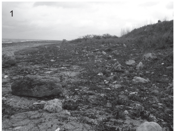
Figs. 1 y 2. Vista de la localidad. 1. En período seco. 2. En período lluvioso.

Se efectuaron tres visitas, entre los meses invernales de enero y febrero, representativos del período seco (Fig. 1) y tres visitas entre los meses de julio y agosto, periodo lluvioso (Fig. 2). Todas las prospecciones se hicieron después de haber llovido copiosamente, entre las 13:00 y las 17:00 hr, lo que permitió la observación in situ de los individuos durante su alimentación. La importancia de haberse visitado el área en ambas estaciones, definidas para nuestro clima, como época de seca y época de lluvia (Berovides, 1985), radicó en obtener datos en las marcadas diferencias de las respuestas fisiológicas de las plantas en ambas estaciones, y de esta forma determinar las posibles relaciones entre la selectividad de estos moluscos y las fuentes de recursos tróficos disponibles.